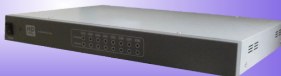
[ KE-PS118 ]