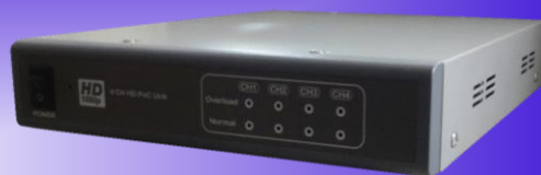
[ KE-PS114 ]