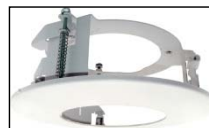
天井埋め込み用金具 MTB-504