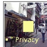
プライバシーマスク機能