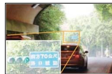
従来のカメラ映像