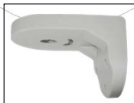
壁面取付用ブラケット MTB-201